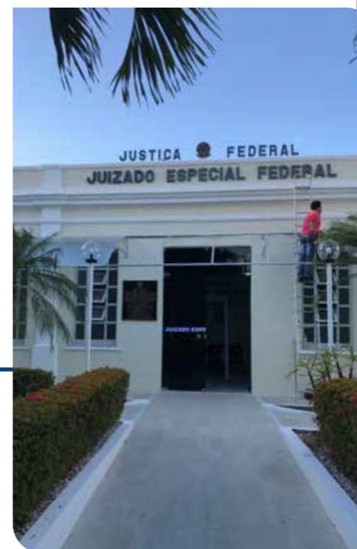
SEDE DA 5ª VARA PASSA POR PRIMEIRA REFORMA DESDE A SUA INSTALAÇÃO

O TRF5 se destacou, ainda, no Índice de Produtividade dos Magistrados (IPM) e no Índice de Produtividade dos Servidores da Área Judiciária (IPS-Jud): 3.580 e 216, respectivamente, mesmo possuindo a maior carga de trabalho por magistrado e por servidor da área judiciária. Estes dados são calculados pela relação entre o volume de casos baixados e o número de magistrados e servidores na jurisdição, respectivamente.