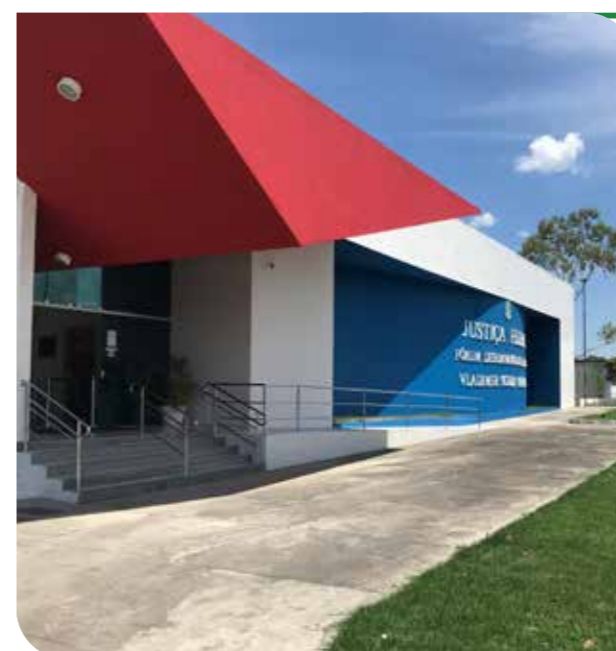
6ª VARA PASSA POR REFORMA E IMPLANTAÇÃO DE SISTEMAS DE IRRIGAÇÃO

Com um investimento total de R$ 416.944,43, a JFSE realizou, em 2017/2018, a Reforma e Implantação dos Sistemas de Irrigação e Segurança Patrimonial do Fórum Desembargador Vladimir Sousa Carvalho, onde funciona a Subseção de Itabaiana - 6ª Vara. Com a reforma, promoveu-se a adequação tecnológica das instalações, implantando sistema de irrigação para a área ajardinada; sistema de segurança patrimonial; e a instalação de concertina, com a finalidade de ampliar a proteção do imóvel.