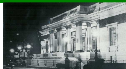
Sede do Tribunal Federal de Recursos no Rio de Janeiro, instalada em 1947

Mesmo com a extinção do primeiro grau da Justiça Federal pela Constituição de 10 de novembro de 1937, quando essa atribuição passou a ser da Justiça Estadual, o segundo grau que analisava os recursos nos processos de interesse da União, competência material da Justiça Federal, continuou a ser o STF, até a instalação do Tribunal Federal de Recursos.