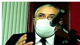
Ronivon de Aragão

29/01/2020 - ANO VI - Nº 194 - ascom@jfse.jus.br